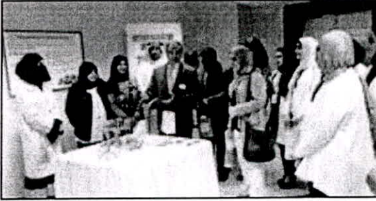
جناح آخر من المعرض

الطالبات مشيدا بدور القسم برئاسة الدكتورة أنيسة الحداد في المشاركة بالأنشطة الثقافية والتوعوية متوجها بالشكر والتقدير لأعضاء هيئتي التدريس والتدريب في قسم العلوم الطبيعية.