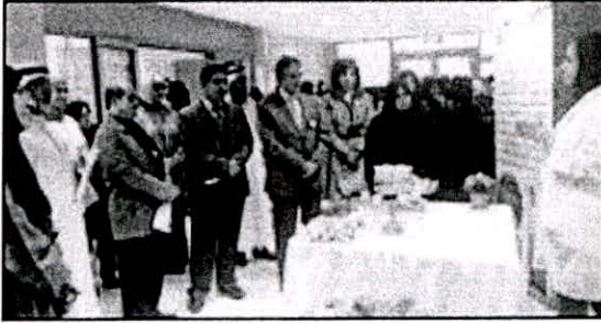
مشرفة على المعرض تشرح محتويات جناح